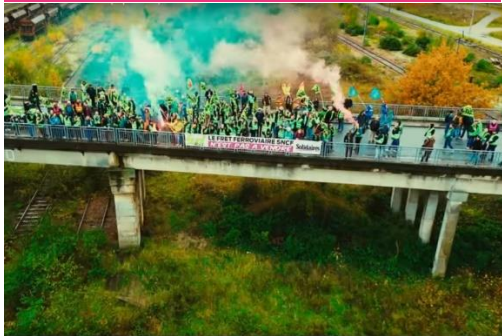
Capture d'écran du clip « On veut du fret ferroviaire », écrit, chanté et tourné par le collectif Planète Boum Boum.